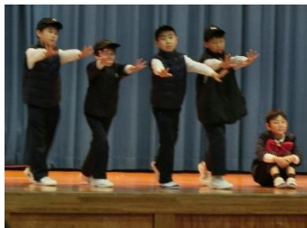
2年生 劇(生活科) 「北かづみ すてき はっけんたい ~町たんけんへ GO!!~」