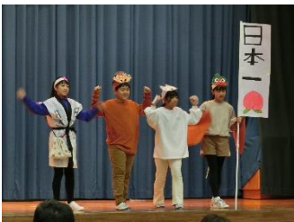
6年生 英語劇(外国語科) 「MOMOTARO」