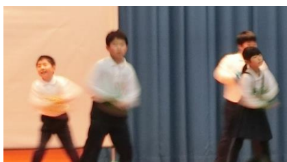
3年生 音楽(音楽科) 「ようこそ! 3年生 の音楽の世界へ」