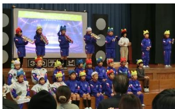
1年生 音読劇(国語科・音楽科) 「おむすびころりん北小編」